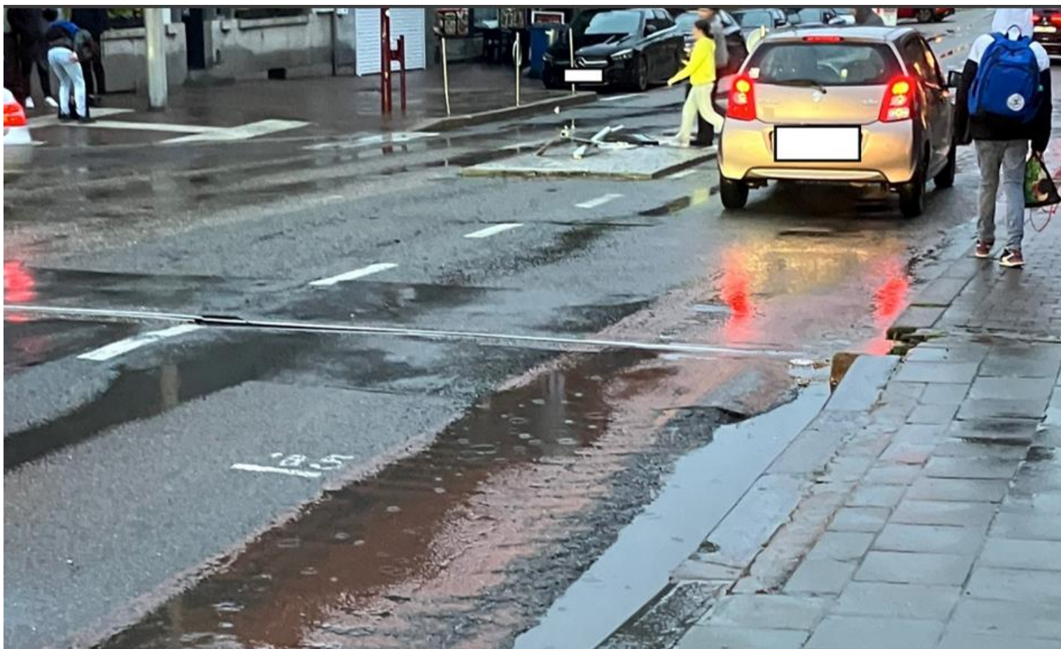
Traversée piétonne en face du PamPam. Le poteau sur l'îlot central est écrasé.