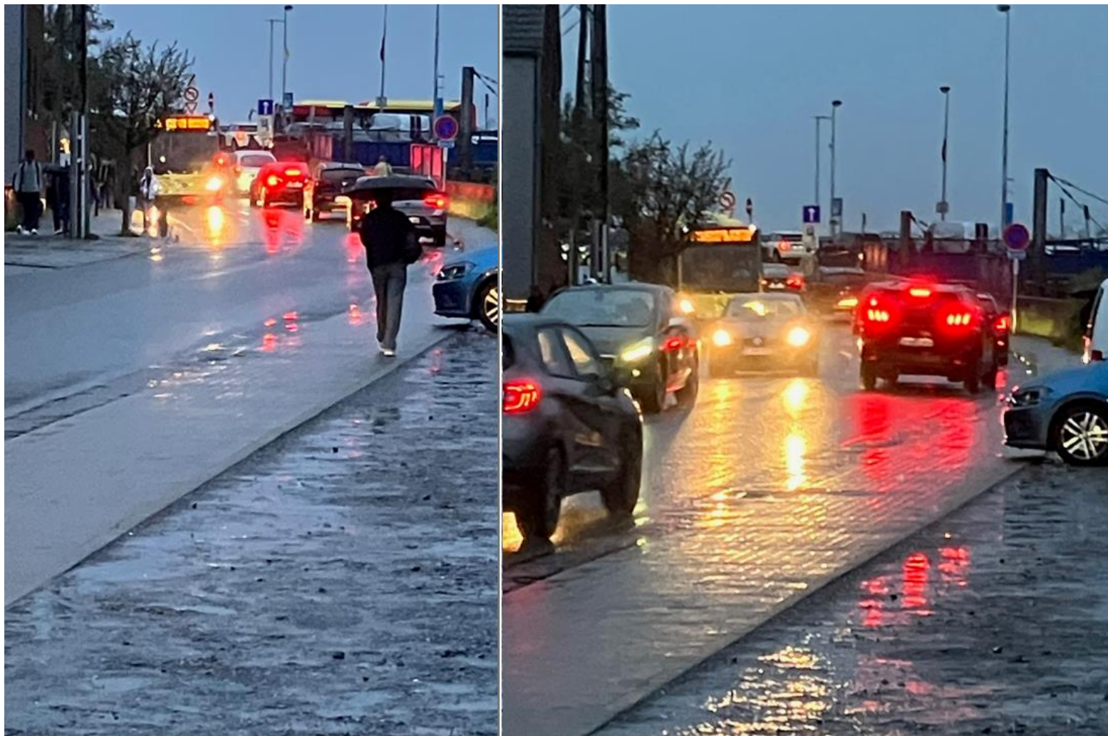
Rue Maréchal Foch, vue vers le pont et la gare actuelle à droite