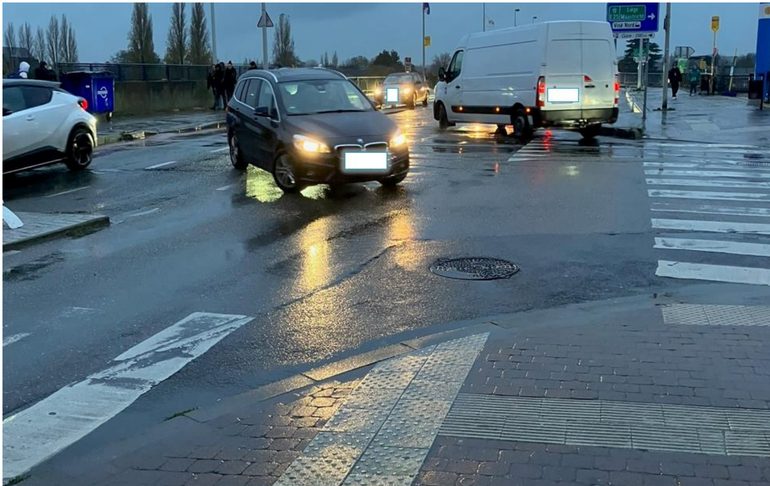
Accès rue Maréchal Foch, venant du pont