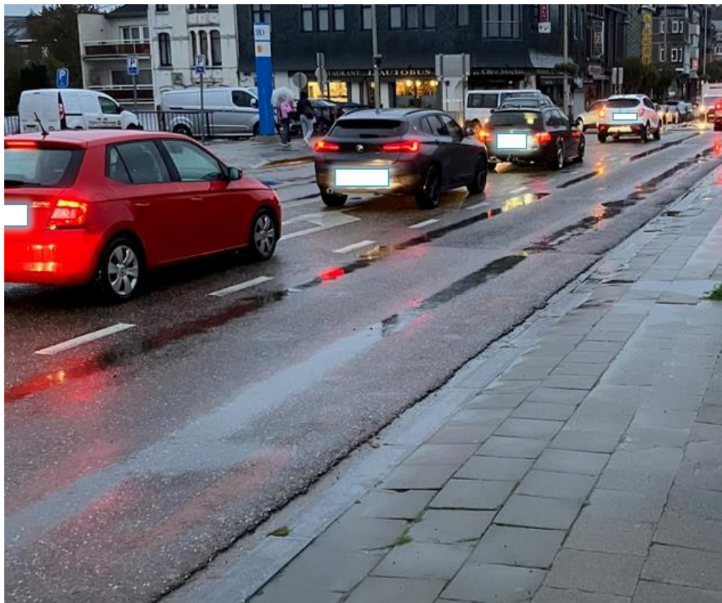
Vue du pont, gare actuelle à gauche