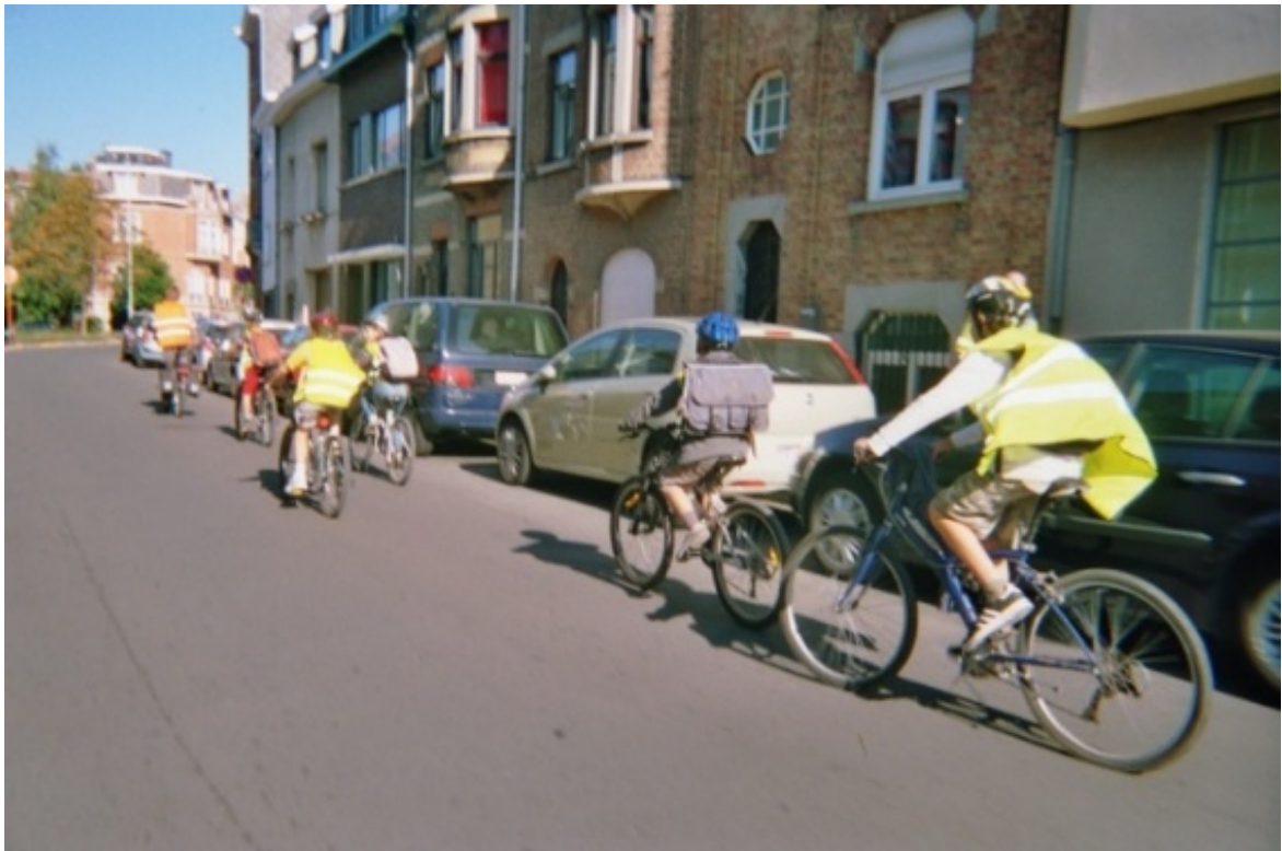
Rang à vélo sécurisé rue de la Fauvette

Le GRACQ Uccle approuve les engagements repris dans le BYPAD, notamment l'article 2.4.5 « Education », dédié au développement et au soutien de la formation à la pratique du vélo. Il serait également important d'aménager un local à vélo au sein des écoles.