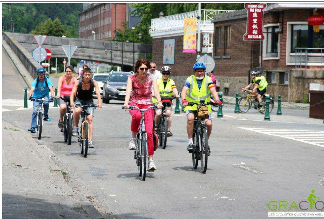
Cyclistes en promenade à Huy