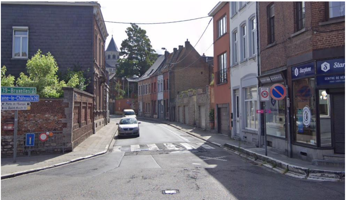
Figure 1 - Exemple de zone 30 beaucoup trop discrète