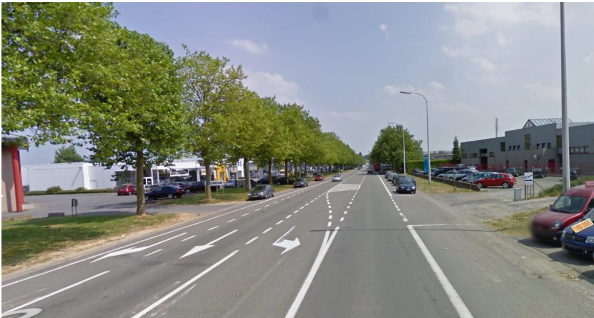
Figure 3 - Zone entre Thines et la pharmacie militaire