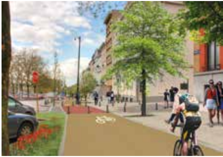
Boulevard de Waterloo : projection.