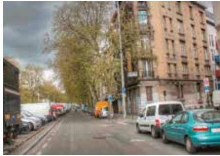
Boulevard du Midi : avant et ...