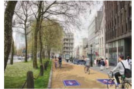
Avenue des Arts : projection.