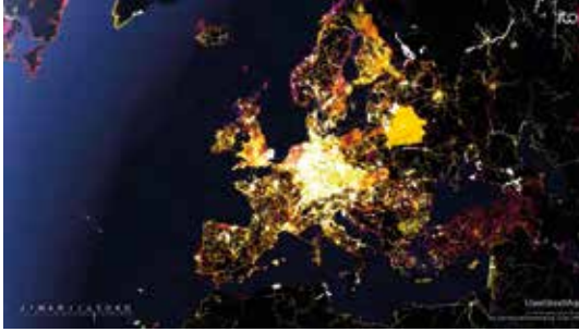
Aperçu des contributions des volontaires d'OSM en Europe (en 2008).

Bâti par une communauté de cartographes bénévoles, OpenStreetMap (OSM) est une base de données géographiques du monde entier qui fonctionne de façon participative (en crowdsourcing). Elle est alimentée de manière volontaire par toute personne qui désire y contribuer, et les données reprises peuvent ensuite être librement utilisées.