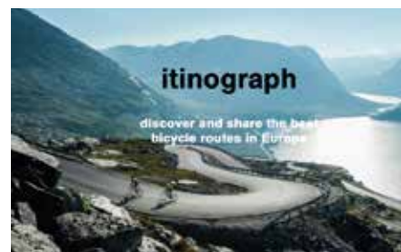
Page d'accueil du site internet.