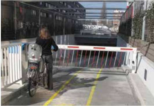
GDF-Suez : entrée du parking sécurisé avec accès vélo.

Le cycliste belge semble globalement satisfait de l'accueil réservé aux cyclistes par son employeur (parking vélo, vestiaires, indemnité vélo), davantage en région bruxelloise (60 %) qu'en Wallonie (47 %). L'indemnité kilométrique vélo est désormais accordée dans 86 % des entreprises de plus de 100 employés, contre 43 % il y a dix ans. Il y a encore du chemin à faire, certes, mais les employeurs vont dans la bonne direction !