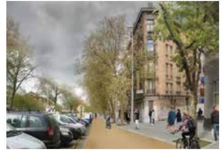
... après !

Par exemple, la piste cyclable bidirectionnelle le long du boulevard du Midi s'interrompra en amont du carrefour Lemonnier et rependra... au-delà du pont du chemin de fer. Entre les deux, une piste cyclable marquée, mais uniquement dans un sens de circulation : il y a fort à parier que de nombreux cyclistes l'emprunteront à contre-sens plutôt que d'effectuer un long et inutile détour.