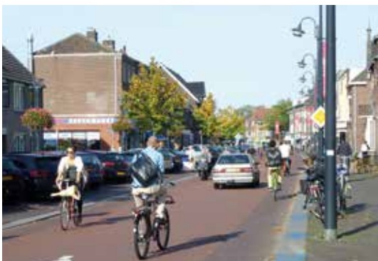
La modération du trafic motorisé est un prérequis pour développer le vélo. Exemple d'Eindhoven.

Notons également que le fort trafic automobile est en lien direct avec le mauvais bilan de la qualité de l'air : ils sont seulement 40 % de cyclistes à juger que la qualité de l'air est bonne sur leurs trajets en Wallonie, et cette proportion tombe à 9 % pour Bruxelles !