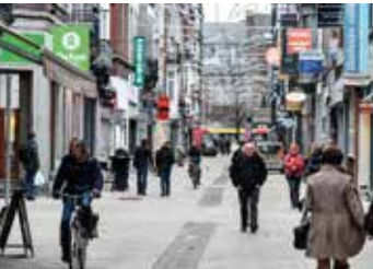
Dans le Carré, à Liège.

En tant que représentants des usagers cyclistes, il était logique pour nos deux associations de prendre la température auprès des premiers concernés : les citoyens eux-mêmes ! C’est sur le sentiment des cyclistes, mais aussi des non-cyclistes, que nous avons choisi d’ancrer notre analyse. Parce que les élus auront beau brandir les kilomètres de pistes cyclables réalisées, le nombre de parkings vélo installés ou encore le nombre de formations organisées dans les écoles, il y a peu de chance que cela convainque le citoyen d’adopter le vélo s’il juge les infrastructures insuffisantes, s’il craint le vol de sa monture, ou s’il ne se sent pas en sécurité sur la route.