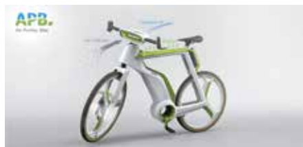
Air Purifier Bike, de Lightfog.

Un anniversaire comme celui que fête le vélo cette année est un moment où l'on se replonge avec amusement dans les images d'archives. Puisque notre deux-roues préféré a évolué et s'est perfectionné au fil des avancées technologiques, comment oser imaginer que la forme que nous lui connaissons ne changera plus ?