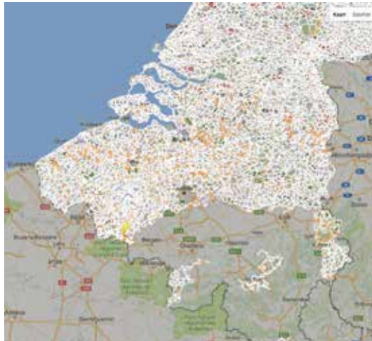
Le réseau Points-Nœuds tel qu'il apparaît sur www.fietsnet.be .

CE SYSTÈME TOUT SIMPLE PERMET DE CIRCULER SANS CARTE SUR DE TRÈS LONGUE DISTANCES