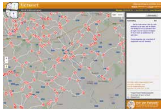
Un détail du réseau qui fait apparaître les tronçons et la numérotation des PN.