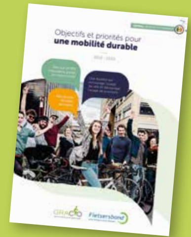
Certaines des revendications portées par le GRACQ lors de la campagne électorale de 2019 ont trouvé écho.

Ce qui manque clairement dans l'accord de coalition, ce sont des mesures visant à réduire la pression automobile. Il ne suffira pas, en effet, de donner plus de moyens à la SNCB pour enclencher un report modal. Concernant les voitures salaires, aucune limitation de leur croissance continue n'est prévue. La recherche sur les causes des accidents de la route impliquant les usa-