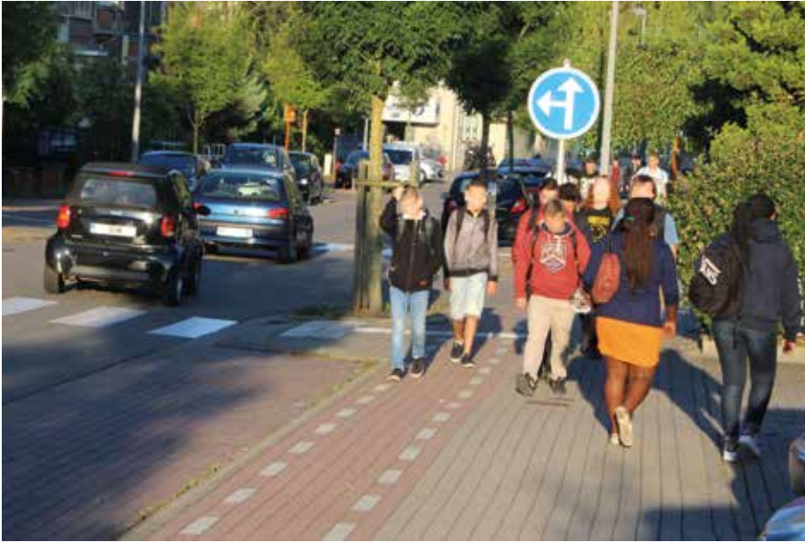
Trottoir partagé, à Braine-l'Alleud.

entre les utilisateurs de l'ancien trottoir cyclo-piéton.